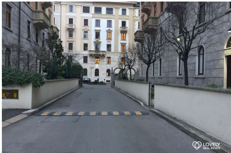
ANTA PIANO RIALZATO